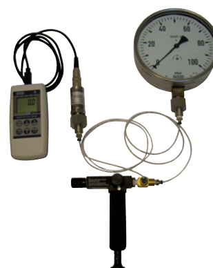
Calibración con bomba de prueba manual modelo CPP7 y medidor de referencia modelo CPH6200