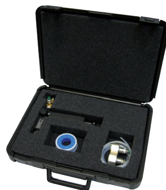
Bomba de prueba manual modelo CPP7 en caja para transporte incl. accesorios estándar