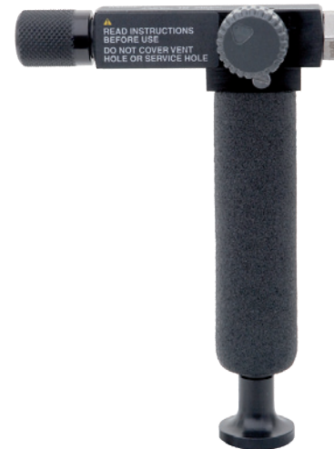
Bomba de prueba manual modelo CPP7