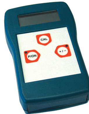
Переносной тензометрический прибор, модель E3906