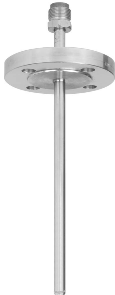
Schutzrohr mit Flansch Typ SD200F

Abhängig von der Druckstufe des Flansches